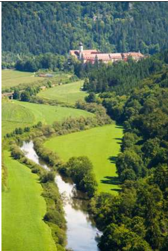
Donautal und Kloster Beuron

Für alle Grafiken und Bilder dieser Seite liegen uns schriftliche Genehmigungen vor bzw. das Urheberrecht liegt ursprünglich bei motorradausfahrt.de. Bei allen Tourvorschlägen handelt es sich um Vorschläge, die noch weiter ausgearbeitet werden müssen. Für die Durchführbarkeit, alle Angaben betreffend Kilometer- und Höhenangaben, Zeitangaben und Übernachtungsmöglichkeiten übernehmen wir keine Gewähr. Weiter gilt der Text in unserer Rubrik "Recht".