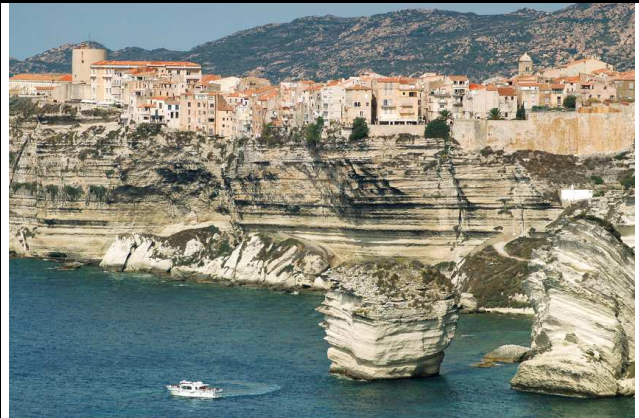
Bonifacio auf Korsika