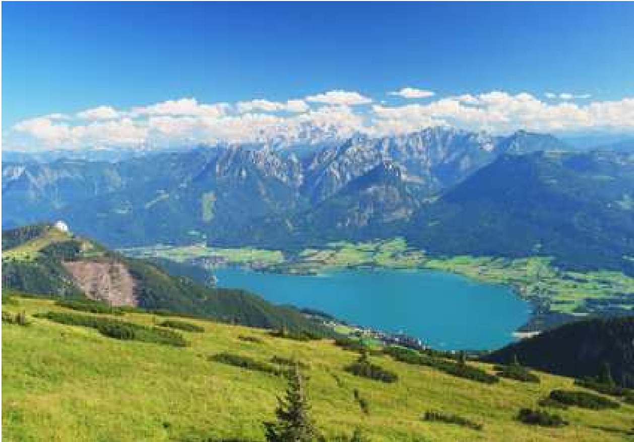
Wolfgangsee mit Dachstein